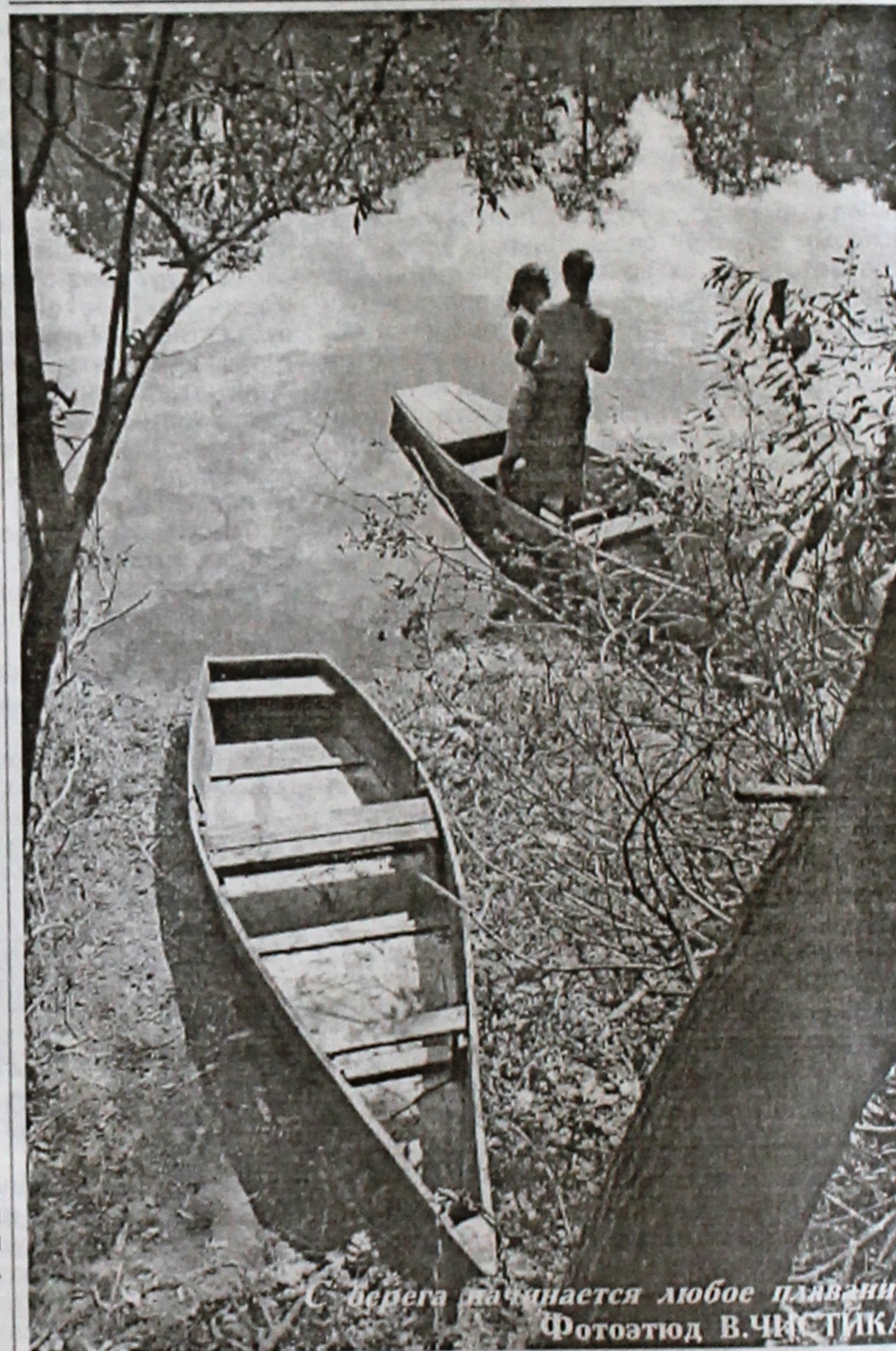
С берега так начинается любое плавание.

Виктор МАРЧЕНКО, выпускник 1963 года факультета физической культуры.