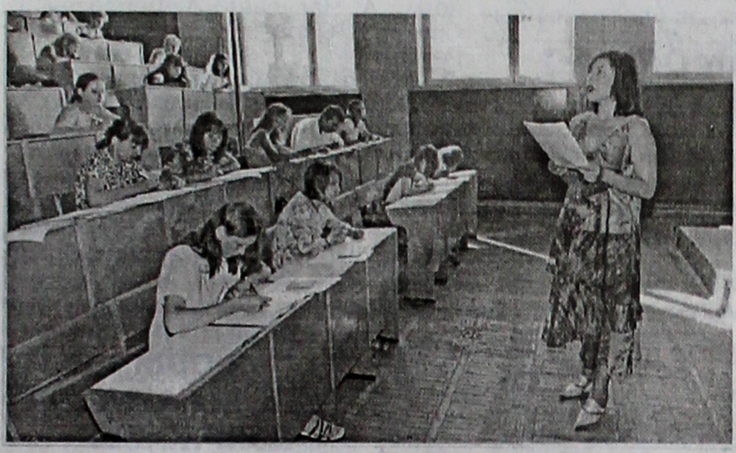
Дыктоўку пішучь абітурыенты спецыяльнасці “Руская філалогія”.

Пры плане прыёму на 27 спецыяльнасцей 1000 чал. абітурыентамі была пададзена 2301 заява. Такім чынам, на кожнае бюджэтнае месца прэтэндавала 2,3 чалавека (летась 2,9).