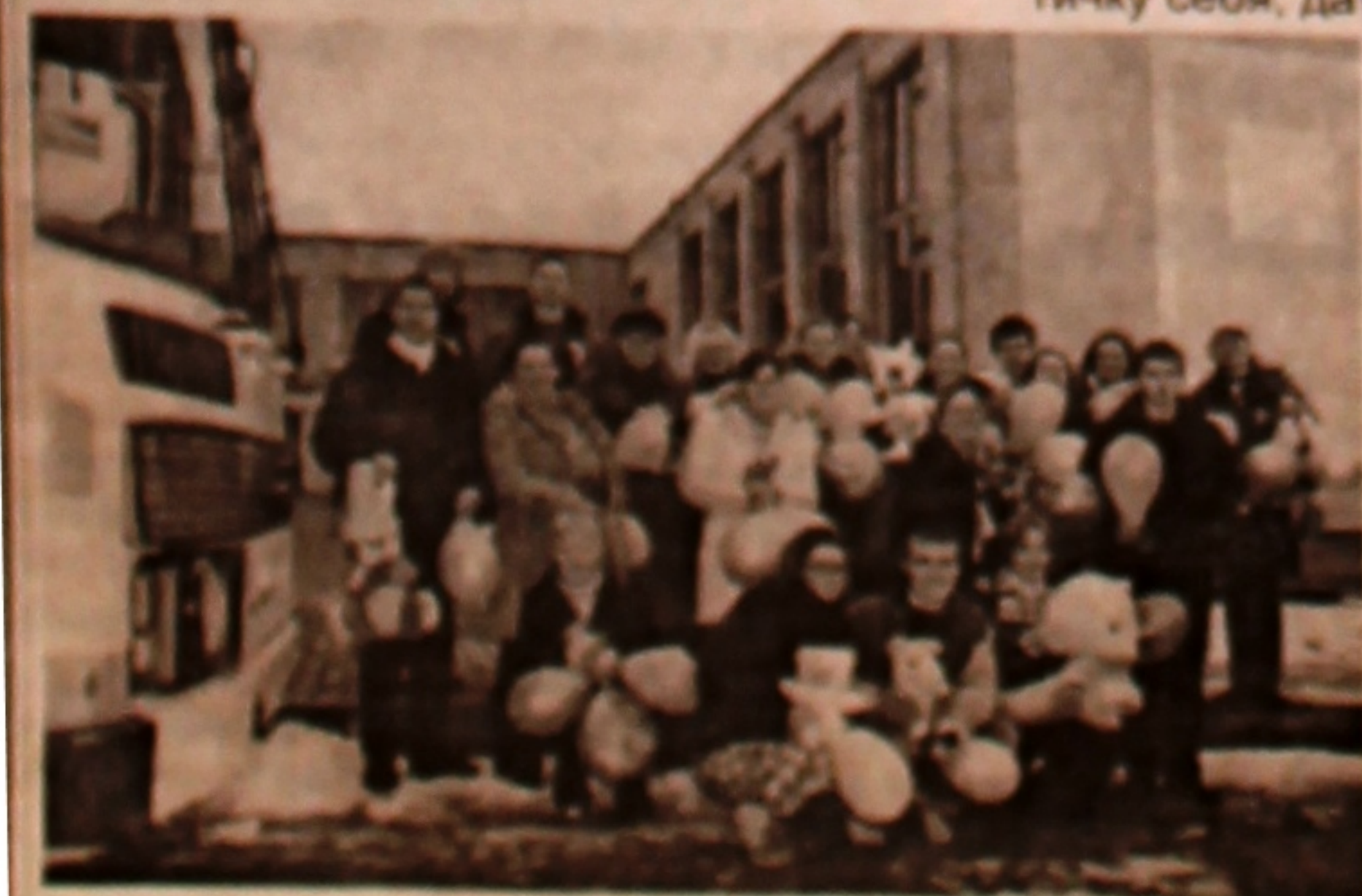
Участники акции возле Журавичской школы-интерната для детей-инвалидов, с которой породнились.