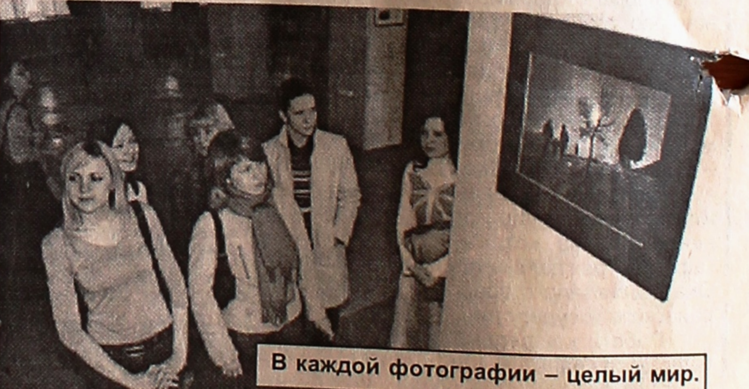
В каждой фотографии – целый мир.

Более двух десятков оригинальных фотографий, сделанных умелыми фотомастерами Пьером Саосомом, Даниелем Масагрие, Ехве Монастье, ярко и красочно отражают всю прелесть города Франции – Клермон-Феррана, провинции Овернь. И бескрайние просторы долин и лугов, и захватывающая высота горных вершин, и величественная статья кафедральных соборов, архитектурных памятников, роскошь фонтанов, и сверкающие огни ночных городов – все говорит о том, что перед нами места необычайной красоты. Есть здесь место и простому человеку: старушке, наводящей порядок в своем жилище, пожилому крестьянину, не желающему расставаться со старым трактором, фермерам, чьими трудами в процессе неторопливого, размеренного течения жизни провинции Сэниктэр, «рождается» превосходный сыр с одноименным названием.