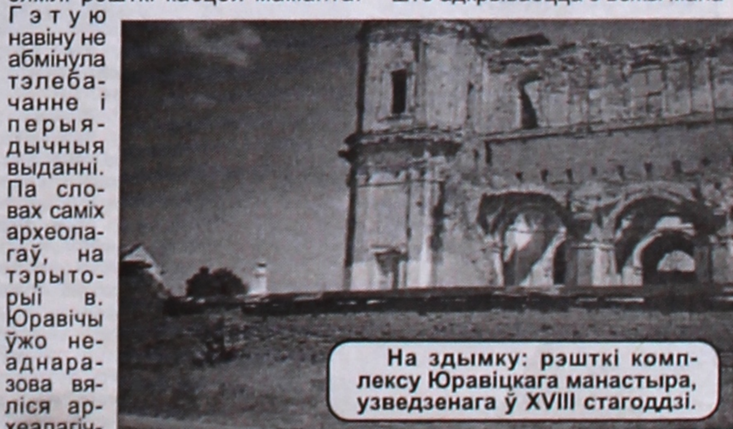
На здымку: рэшткі комплексу Юравіцкага манастыра, узведзенага ў XVIII стагоддзі.

няны вочы музей пад адкрытым небам, цудоўную панараму, што адкрываецца з вежы мана-