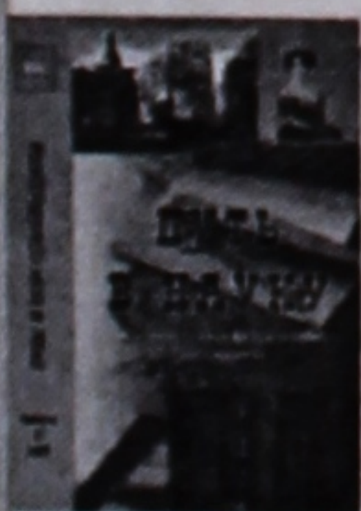
Сборник посвящен научно-педагогическим работникам вузов, сотрудникам академических НИИ и отраслевых КБ, инженерно-техническим работникам государственных и частных предприятий, которые добились определенных успехов в профессиональной научной деятельности.

С января месяца в нашем университете работает постоянно действующая комиссия, по решению которой будет частично компенсироваться проезд студентам и магистрантам дневной формы обучения, в семьях которых ежемесячный доход на одного человека не превышает 248 тыс. руб. Для этого студенту (магистранту) необходимо до 8 числа каждого месяца (в феврале до 15-го) подавать в деканат факультета заявление с просьбой об оказании материальной помощи на проезд, справки о доходах членов семьи за последние полгода (о заработной плате каждого из родителей, о стипендии братьев и сестер, а если родители пенсионеры — справки о размере пенсии). Также нужно приложить к ним проездные документы за месяц, предшествующий месяцу обращения за матпомощью на проезд. И еще одно весьма существенное условие: ее получают только те, кто соблюдает учебную дисциплину, Правила внутреннего трудового распорядка университета.