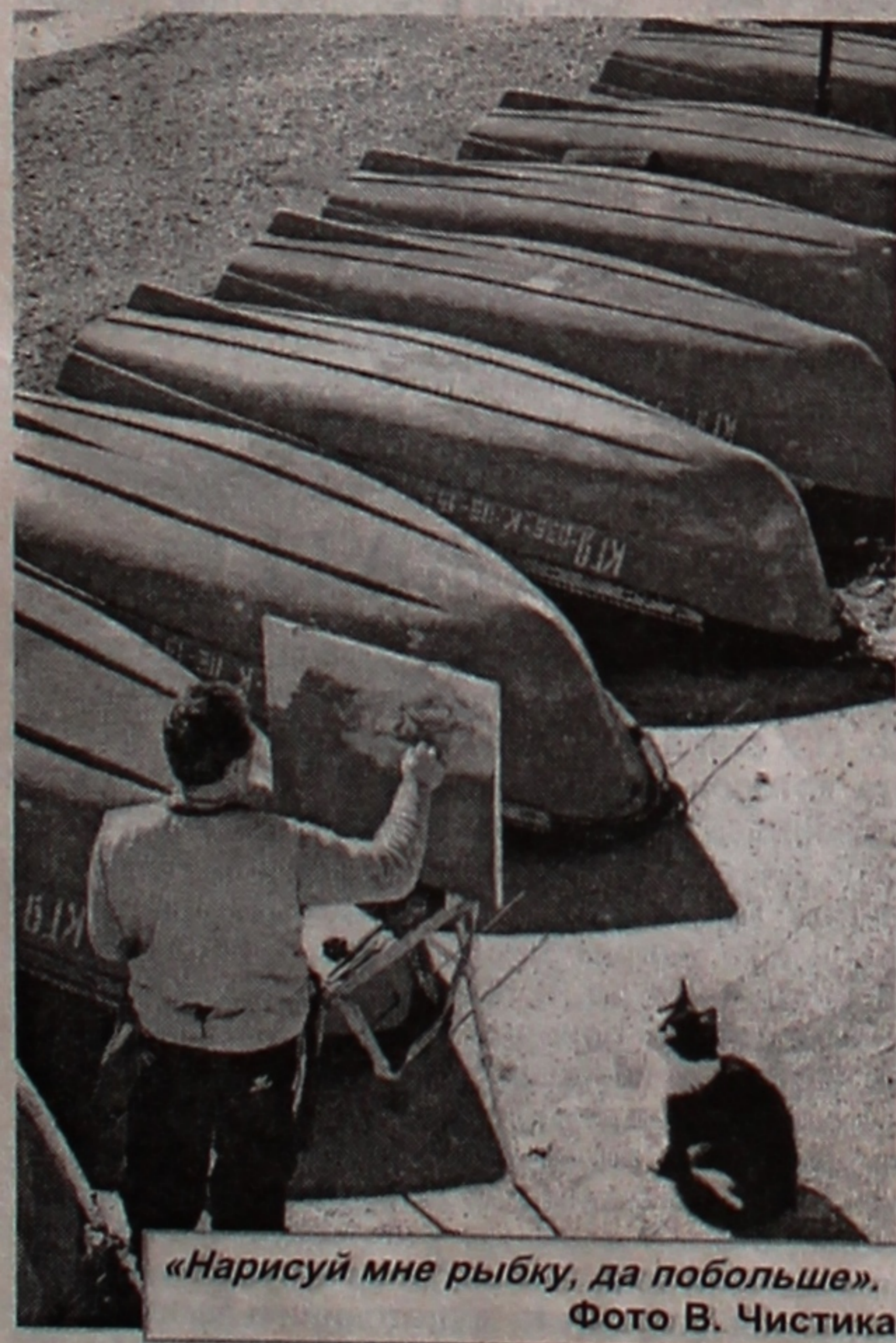
«Нарисуй мне рыбку, да побольше».

Рэктарат, грамадскія арганізацыі ўніверсітэта, калектывы факультэта псіхалогіі і педагогікі, кафедры педагогікі выказваюць глыбокае спачуванне старшаму выкладчыку ВАЛЬЧАНКА Святла-не Анатольеўне з выпадку напатакушага яе гора — смерці МАЦІ.