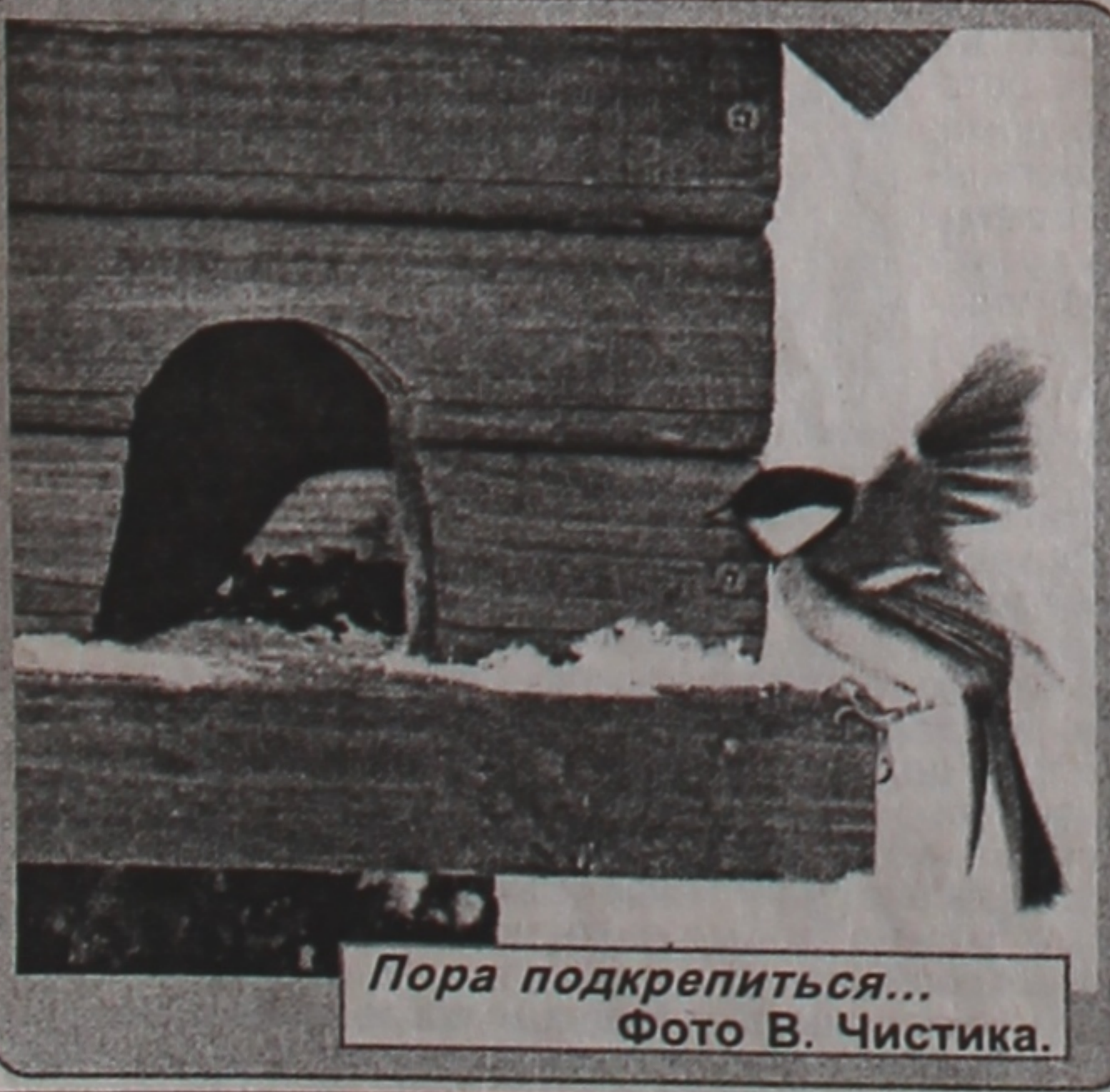
Пора подкрепиться...