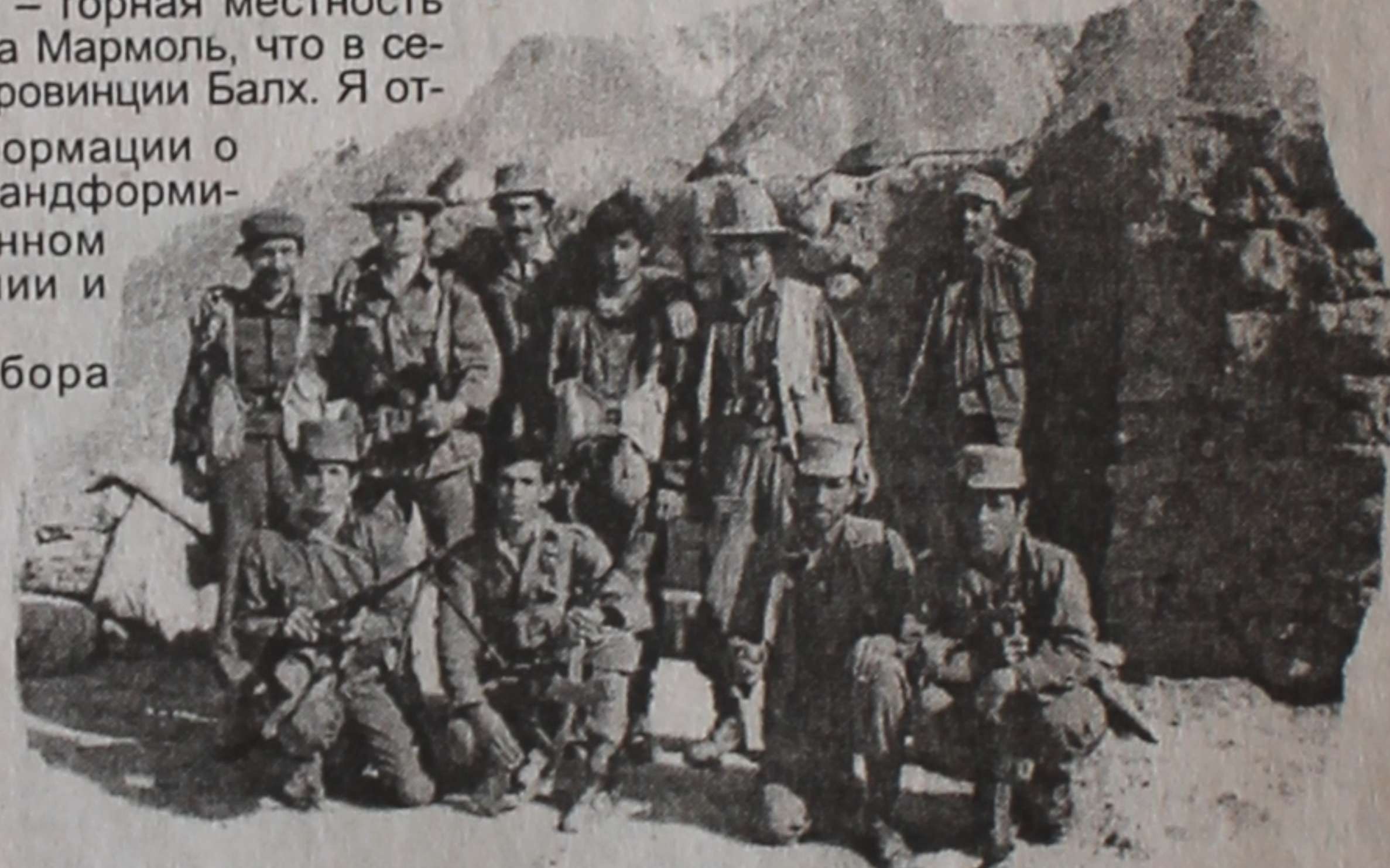
С афганскими товарищами перед боем.

Экзотика была на каждом шагу. Ночью по стенам землянки шуршали скорпионы, тарантулы и прочая живность. И днем, и ночью можно было запросто повстречаться с какой-нибудь змеей, в том числе и на территории базы. Главное – вовремя заметить ее и мирно разойтись. Сами змеи первыми почти не нападали. Правда, взаимоотношения нашей собакаминосителя с одной из кобр что-то не заладились: в итоге погибли обе, вцепившись друг в друга. Такими мы их и на-