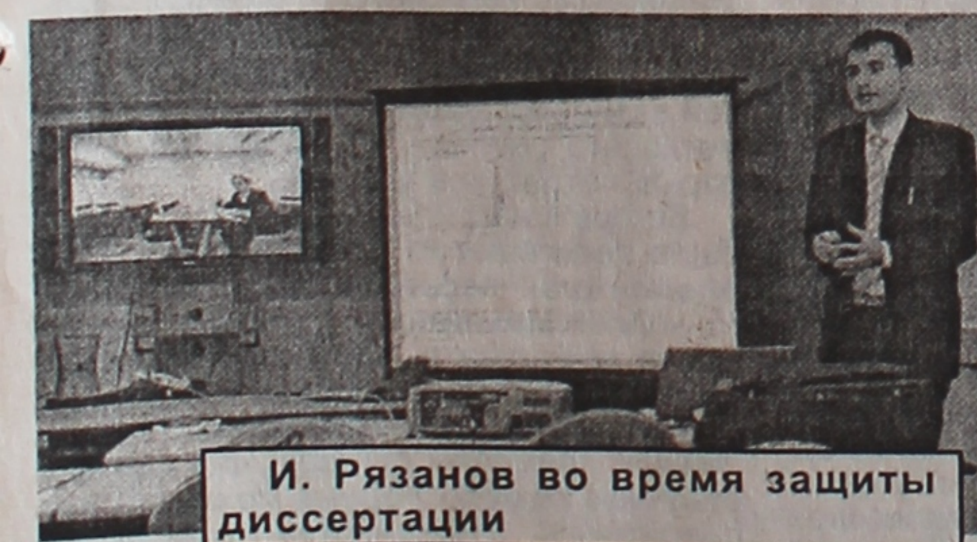
И. Рязанов во время защиты диссертации