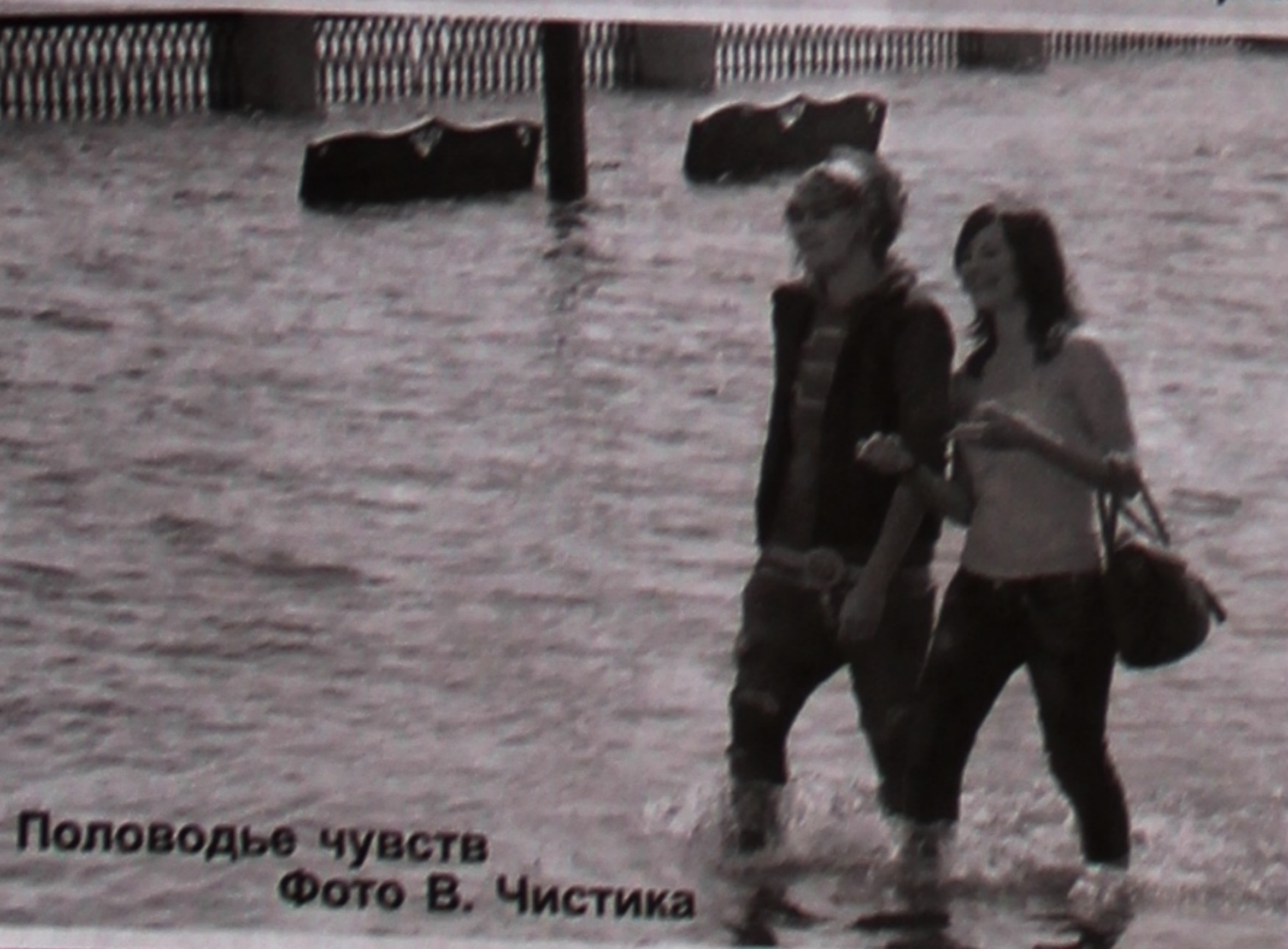
Половодье чувств.

В. ХИМАКОВ, преподаватель кафедры физического воспитания и спорта.