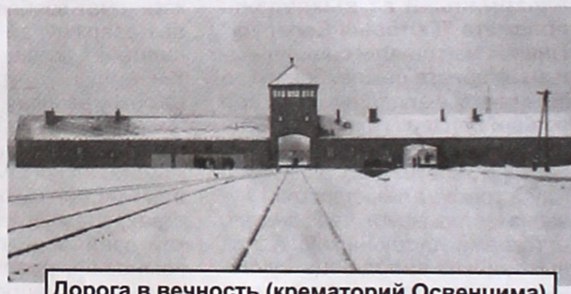
Дорога в вечность (крематорий Освенцима)

ние трагических событий Второй мировой войны должно содействовать недопущению межэтнической и межрасовой нетерпимости, унижения человеческого достоинства и нарушения прав человека.