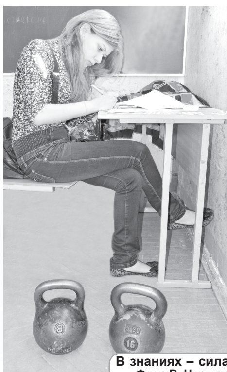
В знаниях – сила!