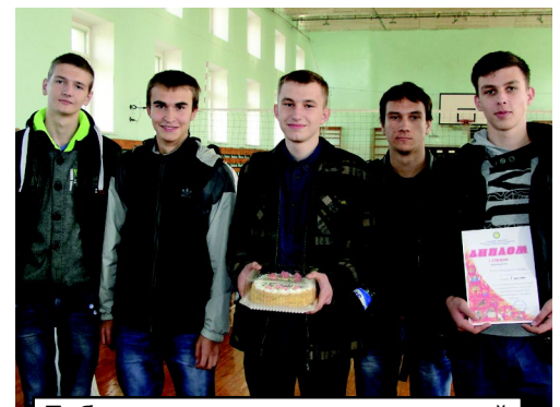
Победители мужских соревнований – студенты матфака