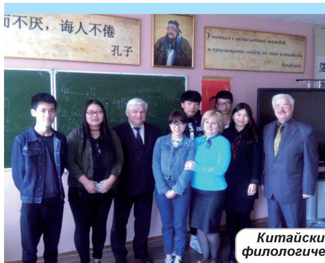
Китайские студенты со своим руководителем и преподавателями филологического факультета в Кабинете Конфуция ГГУ им. Ф. Скорины

В. КОВАЛЬ, заведующий кафедрой русского, общего и славянского языкознания