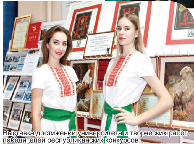
Выставка достижений университета и творческих работ победителей республиканских конкурсов

— Сегодня гражданский долг каждого гражданина прийти на избирательный участок и выразить свою позицию. Я голосую за баланс стабильности и прогресса, за стабильное развитие нашего государства, совместную работу депутатов и местной власти, — поделился губернатор.