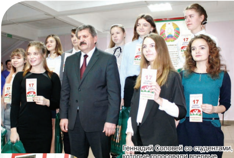
Геннадий Соловей со студентами, которые голосовали впервые

Высокую активность в важной политической кампании проявили преподаватели, студенты и сотрудники ГГУ имени Ф. Скорины. Свой гражданский долг на участке для голосования №17, расположенном в учебном корпусе №2, выполнил и председатель Гомельского облисполкома Геннадий Соловей.