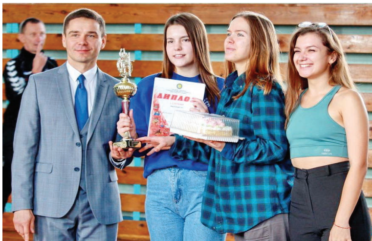
Победительницам и призеркам вручают дипломы и кубок от спортклуба, сладкий приз от профкома студентов, пригласительные билеты на игру чемпионата Беларусь от хоккейного клуба «Гомель»

В результате напряженной борьбы победу отпраздновали представительницы факультета математики и технологий программирования. Серебряным призером стала сборная экономического факультета. III место досталось волейболисткам факультета психологии и педагогики. В шаге от пьедестала оказалась команда факультета иностранных языков.