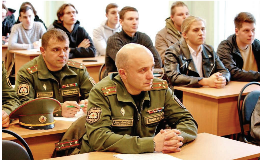
Студенты ГГУ имени Ф. Скорины и ГГУ имени П.О. Сухого – одни из первых в Беларуси, кто будет получать военно-учетную специальность в таком формате

Договор о сетевой форме взаимодействия между ГГУ имени Франциска Скорины и Белорусским государственным университетом транспорта подписан.