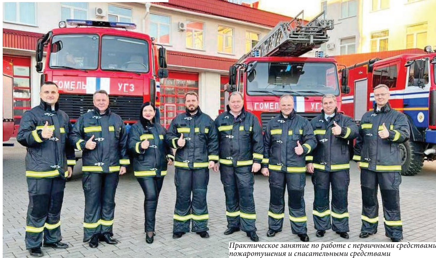
Практическое занятие по работе с первичными средствами пожаротушения и спасательными средствами

В Гомельском филиале Университета гражданской защиты МЧС Беларуси прошел Совет ректоров учреждений высшего образования Гомельщины.