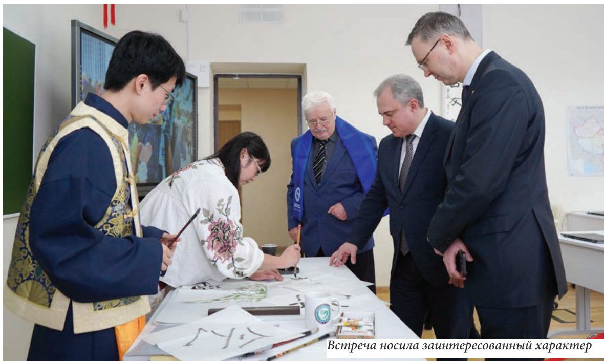
Встреча носила заинтересованный характер