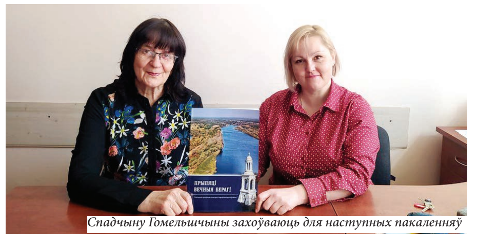
Спадчыну Гомельшчыны захоўваюць для наступных пакаленняў

«Прыпяці вечныя берагі» – так называецца кніга, прысвечаная культурна-гістарычнай і фальклорна-этнаграфічнай спадчыне Нараўлянскага раёна.