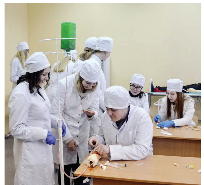
Встреча студентов была интересной и полезной

Актив студенческого совета ГГУ посетил учебный центр практической подготовки и симуляционного обучения Гомельского медуниверситета.