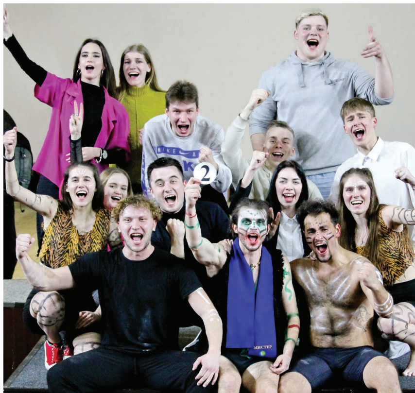
«Мистер университет» учится на факультете физической культуры

Поддержка зала была просто сумасшедшей: свистелки, кри-