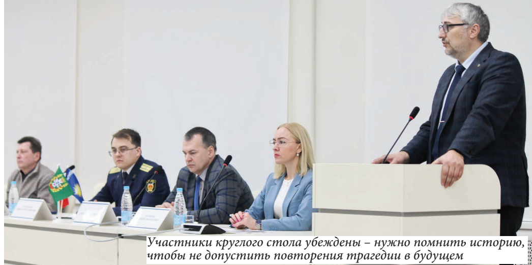
Участники круглого стола убеждены – нужно помнить историю, чтобы не допустить повторения трагедии в будущем

В ГГУ прошел круглый стол «Трагедия Хатыни – наша память и боль». Его участниками стали студенты и преподаватели, представители госструктур, идеологического актива, общественных объединений и районных организаций областной организационной структуры «Белорусское общество «Знание».