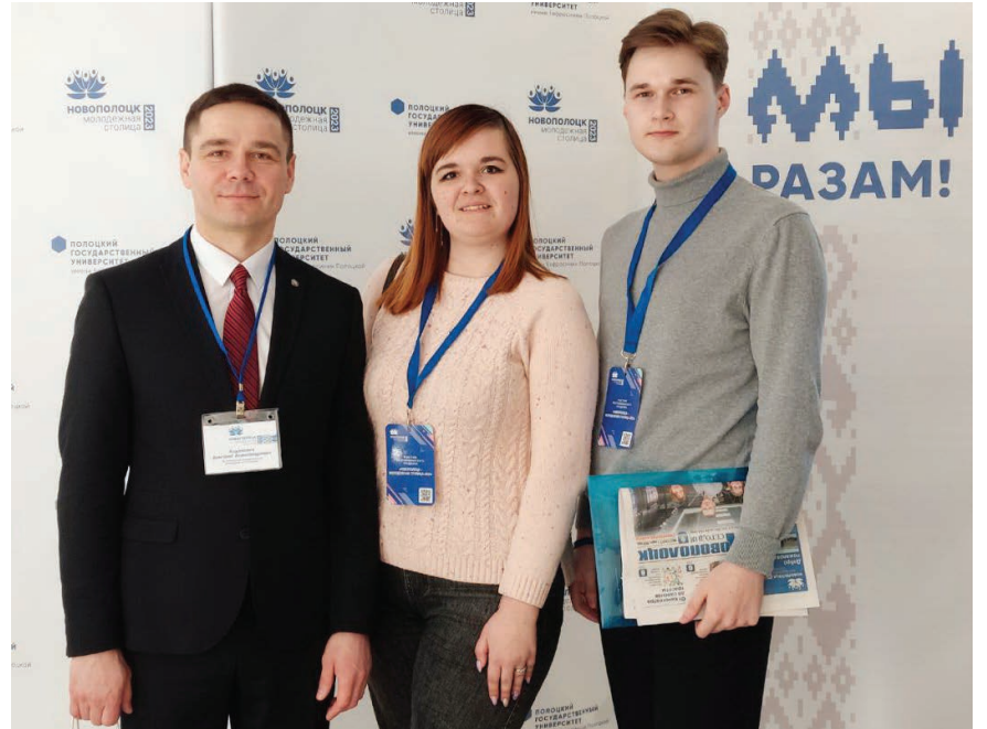
Новополоцк был эпицентром притяжения молодежи и тех, кто работает в сфере реализации государственной молодежной политики

Представители Гомельщины стали участниками праздника «Новополоцк – Молодежная столица Республики Беларусь-2023» и форума «Беларусь. Молодежь. Созидание».