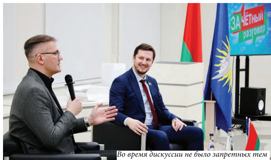
Во время дискуссии не было запретных тем