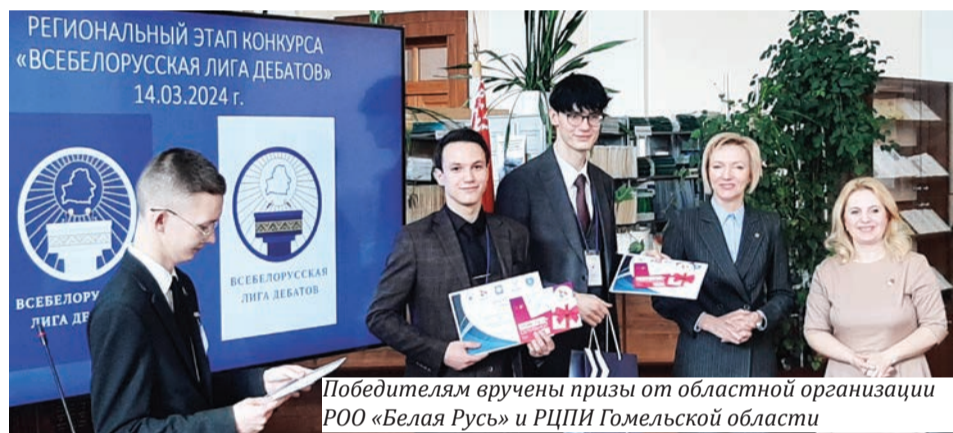
Победителям вручены призы от областной организации РОО «Белая Русь» и РЦПИ Гомельской области

В региональном этапе конкурса «Всебелорусская лига дебатов», прошедшем на юрфаке, приняли участие 32 студента из 16 команд шести университетов области.