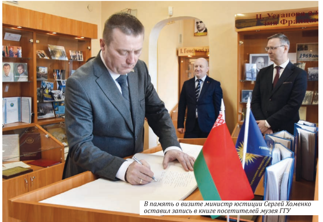
В память о визите министр юстиции Сергей Хоменко оставил запись в книге посетителей музея ГГУ