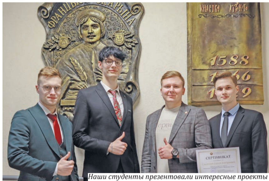
Наши студенты презентовали интересные проекты

В БГУ состоялся полуфинал национального молодежного конкурса «Инициатива лидера», призванного поддержать разноплановые, перспективные, социально значимые проекты и инициативу молодых лидеров страны.