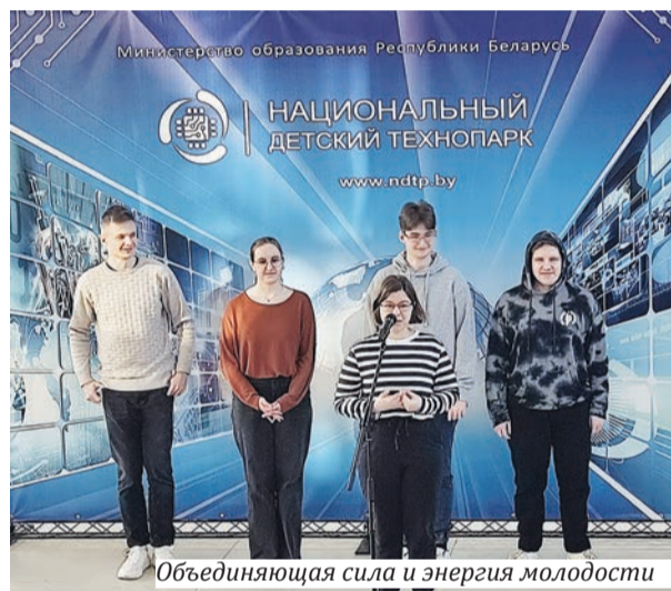
Объединяющая сила и энергия молодости