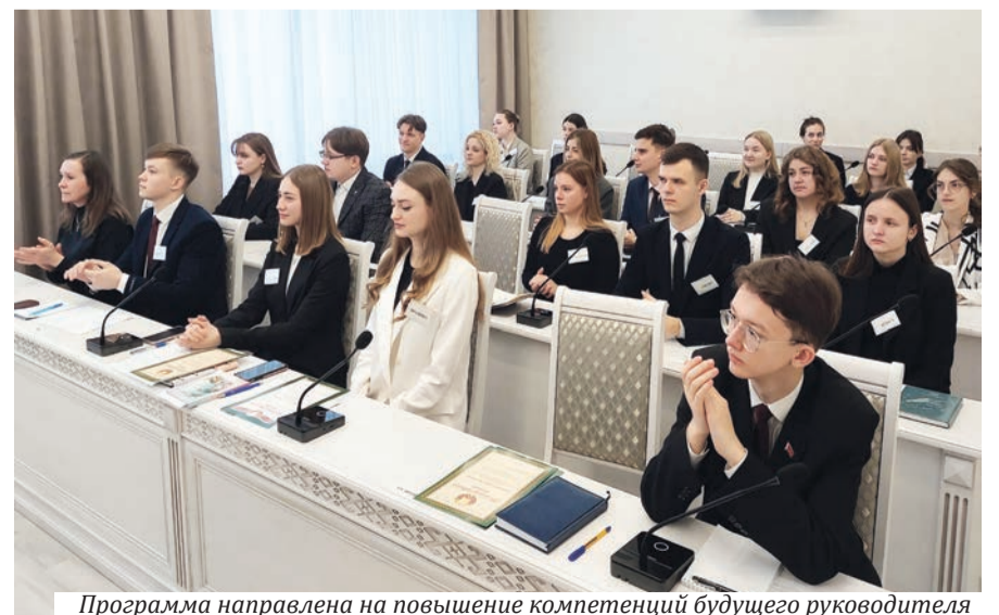
Программа направлена на повышение компетенций будущего руководителя