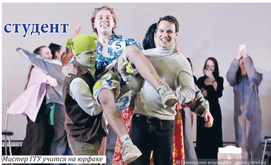
Мистер ГГУ учится на юрфаке