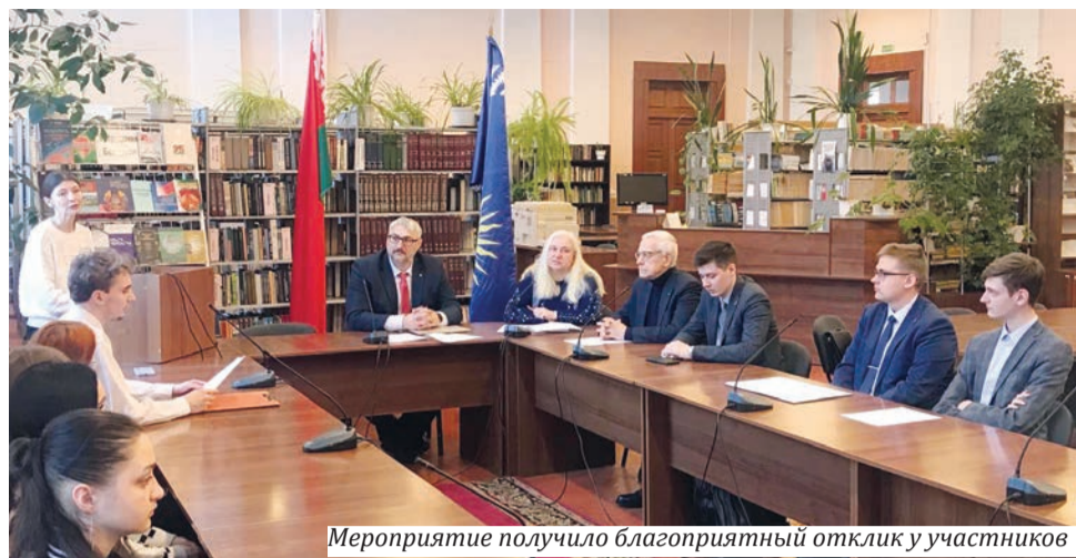
Мероприятие получило благоприятный отклик у участников