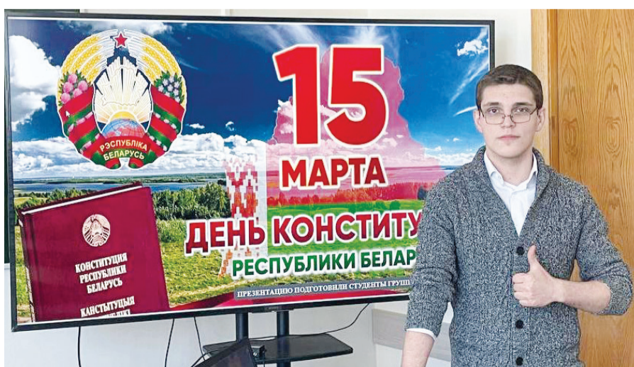
Каждый участник старался сделать проект уникальным и познавательным