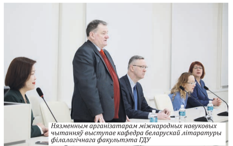
Назменным арганізатарам міжнародных навуковых чытанняў выступае кафедра беларускай літаратуры філалагічнага факультэта ГДУ

Работа канферэнцыі адбывалася ў трох секцыях. Спадчына Івана Наву-