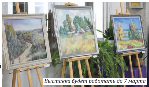
Выставка будет работать до 7 марта

В выставочном зале университета состоялось открытие выставки «Фарбы маёй зямлі», организованной Гомельским государственным художественным колледжем при поддержке администрации вуза.