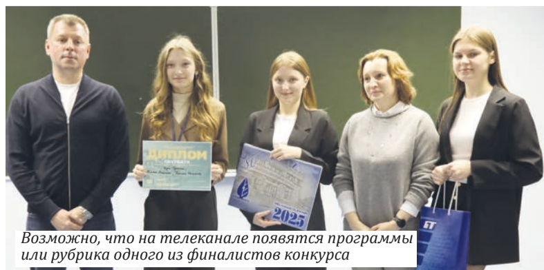
Возможно, что на телеканале появятся программы или рубрика одного из финалистов конкурса

Побывать по ту сторону экрана и узнать секреты телевизионной кухни Белтелерадиокомпании смогли финалисты 4-го сезона молодежного совместного проекта журфака БГУ и Белтелерадиокомпании «Тивиар».