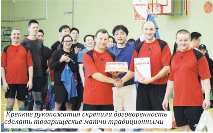
Крепкие рукопожатия скрепили договоренность сделать товарищеские матчи традиционными

Два ярких спортивных мероприятия оставили теплые воспоминания.