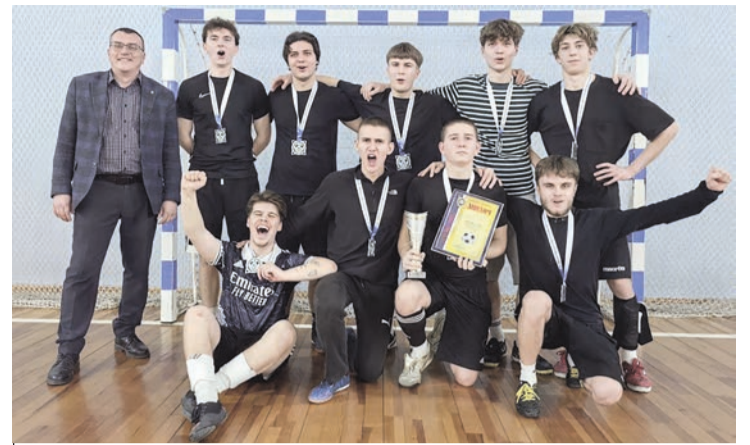
Команда юридического факультета стала серебряным призером чемпионата

горотдела игра завершилась вничью 0:0, и судьбу матча определила серия пенальти, в которой наши ребята одержали победу. В финале победу