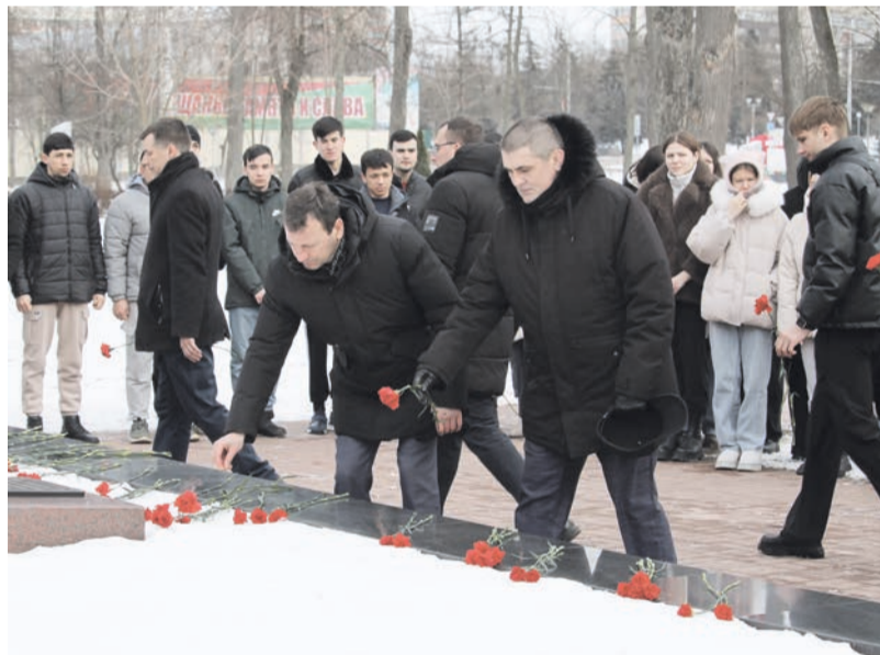
Участники митинга возложили венки и цветы к памятнику, почтили память погибших минутой молчания