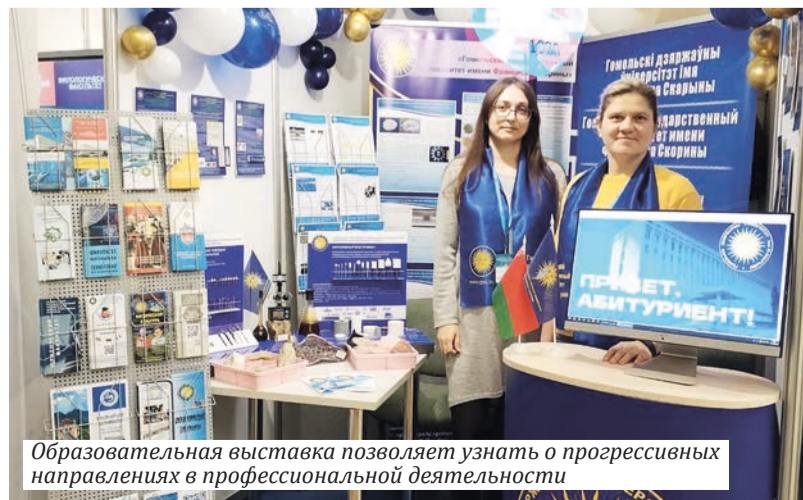
Образовательная выставка позволяет узнать о прогрессивных направлениях в профессиональной деятельности