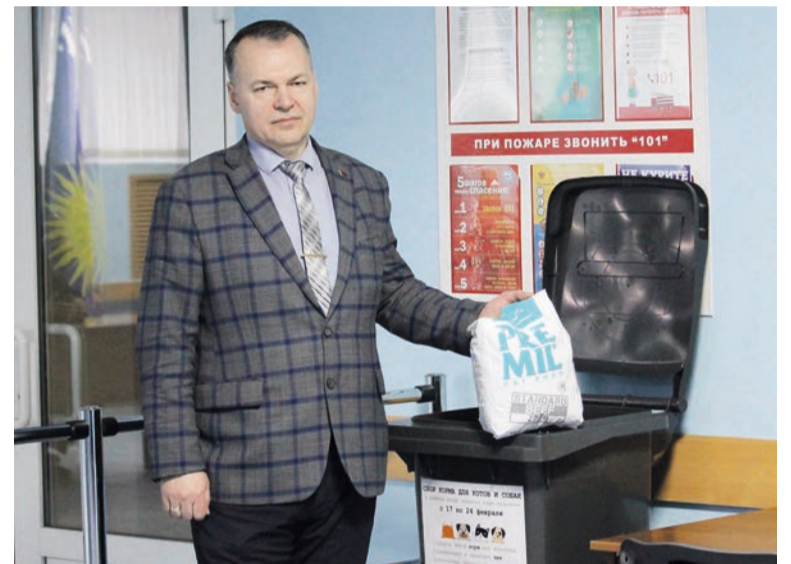
В ГГУ прошла акция по сбору корма для бездомных животных, находящихся в КУП «Спецкоммунтранс». Доброе дело организовано Молодежным советом при поддержке Гомельского горсовета депутатов и учреждениями высшего образования города над Сожем.