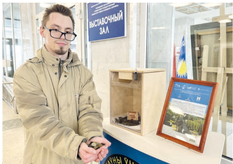
Преподаватели и студенты присоединились к акции по сбору монет для создания памятника «Живая память благодарных поколений» в Москве. Ящик для сбора монет установлен в фойе перед выставочным залом университета (ул. Советская, 104, корпус 4) до 31 марта.