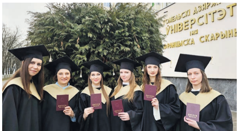
На факультете психологии и педагогики традиционно вручили заслуженные дипломы магистра по специальности «Психология» магистрантам заочной формы обучения