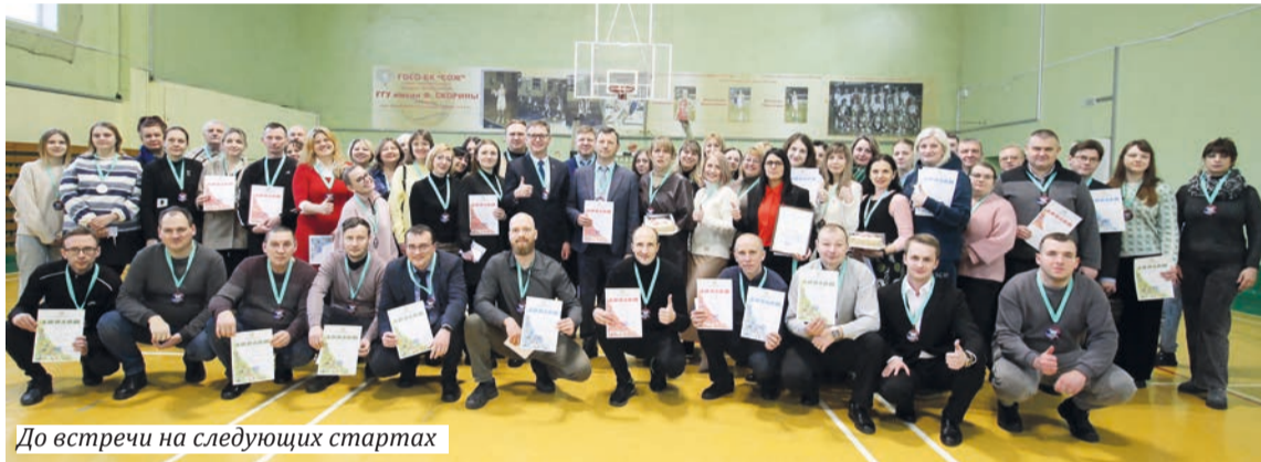
До встречи на следующих стартах

В ГГУ зрелищно и спортивно прошла ежегодная спартакиада для работников вуза под говорящим названием «Здоровье-2025».