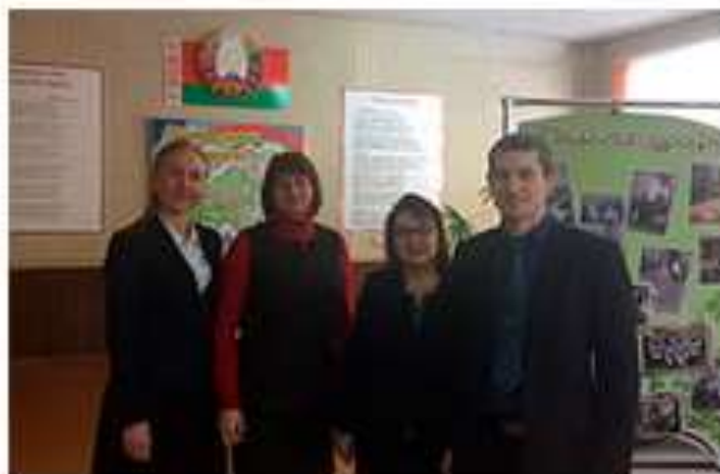
В объективе непрерывного образования 31.01.2017