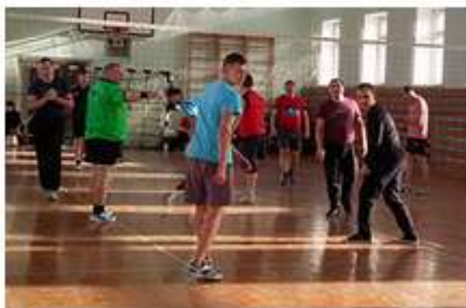
Спартакиада «Здоровье – 2017» 31.01.2017