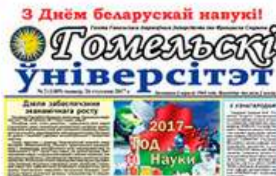
Газета "Гомельский университет" Выпуск № 2 от 26.01.2017 Архив номеров

Центр тестирования График приема Online-регистрация Памятка для абитуриентов Дополнительная информация Приглашение на мероприятия