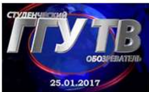
ГУ ТВ, новое на канале: ГУ ТВ. Январь 2017 Национальный центр правовой информации