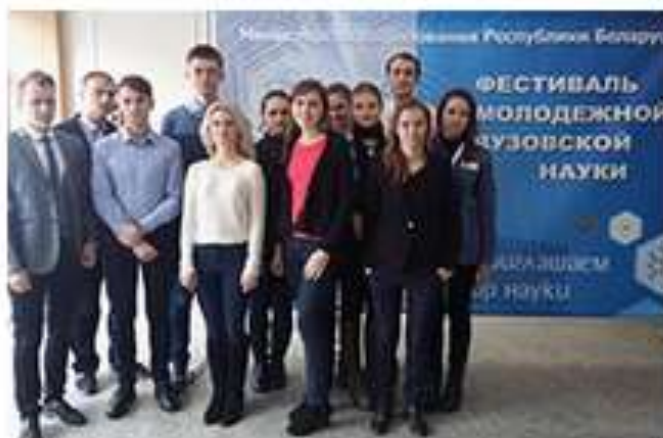
Фестиваль молодежной науки 02.02.2017