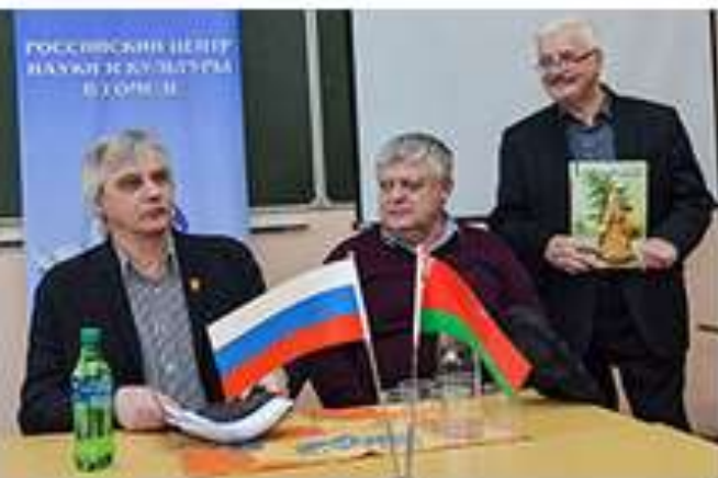
Укрепление традиций культурного сотрудничества 31.01.2017