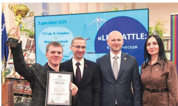
Престижный кубок достался студентам ГГУ

В викторине принимали участие студенты 2-4 курсов юридических специальностей ГГУ (команда «Рыси юстиции») и МИТСО (команда «Оперочки»). Им предстояло соревноваться в пяти раундах: «Юридический блиц», «Правда или ложь», «Юридические ситуации», «Латинский суд», «Судебные прения». Участники показали