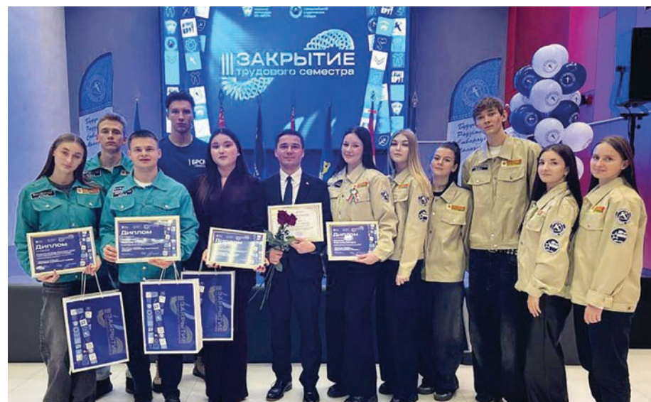
Завоеванное первое место – это мощный старт для новых свершений