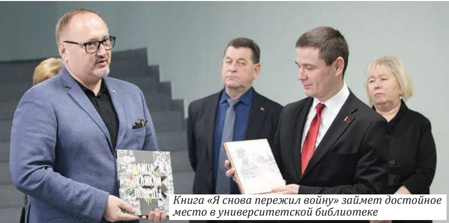
Книга «Я снова пережил войну» займет достойное место в университетской библиотеке

В ГГУ открылась выставка «Четыре фронта – одна Победа! Операция «Багратион», 23 июня – 29 августа 1944 года». Она подготовлена Белорусским фондом мира при содействии Фонда сохранения исторической памяти имени Маршала Баграмяна (Россия).