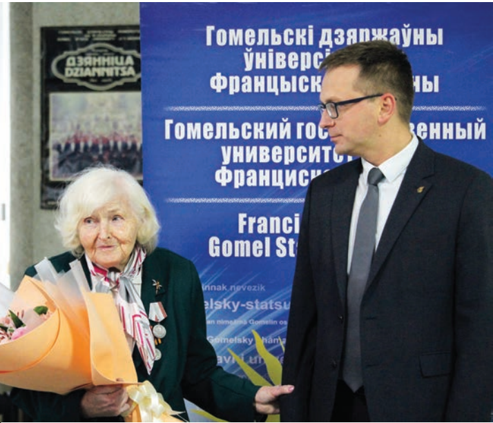
Такие встречи вдохновляют молодежь на серьезное изучение истории своей страны