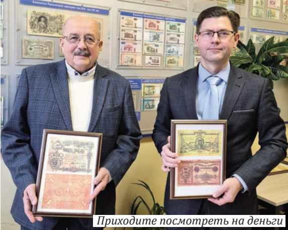
Приходите посмотреть на деньги

номический факультет нашего университета в 1982 году. Вся его деятельность, кроме службы в армии и обучения в аспирантуре в Москве, проходила в нашем вузе. Трудился ассистентом, преподавателем, доцентом на кафедре, заведующим кафедрой АСОИ, 16 лет был проректором по научной работе.