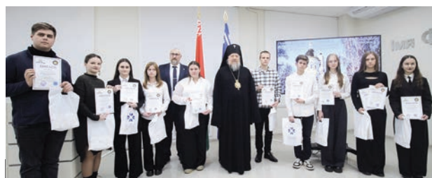
Лучшие работы отмечены дипломами ГГУ и Гомельской епархии Белорусской православной церкви

В нашем вузе прошли Покровские образовательные чтения, организованные общественной кафедрой христианской культуры и кафедрой всеобщей истории.