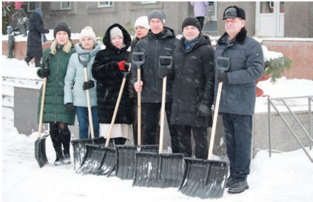
Представители коллектива вуза, вооружившись лопатами, совместными усилиями расчищали территорию, прилегающую к учебным корпусам университета и общежитий, обрабатывали тротуары противогололедными средствами

ственно в весовых категориях 65 и 70 кг. Команда Гомельской области в первенстве по вольной борьбе заняла 3 место. Пресс-центр ГГУ