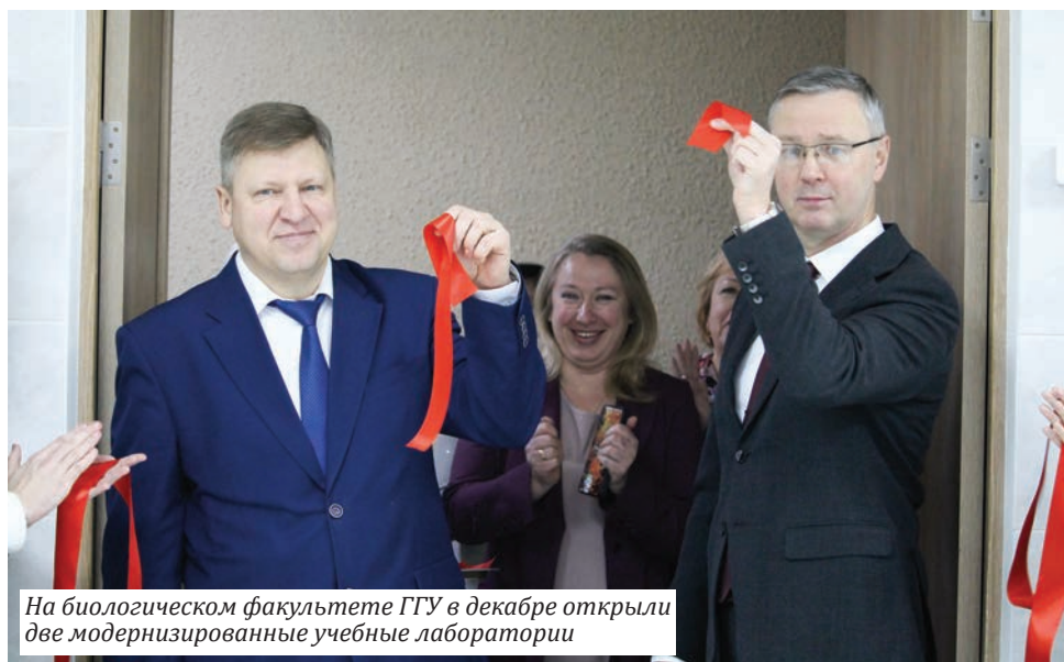
На биологическом факультете ГГУ в декабре открыли две модернизированные учебные лаборатории

Отраслевой НИЛ технологий проектирования и синтеза функциональных материалов электронной промышленности в минувшем году осуществлено изготовление и поставка полирующей суспензии