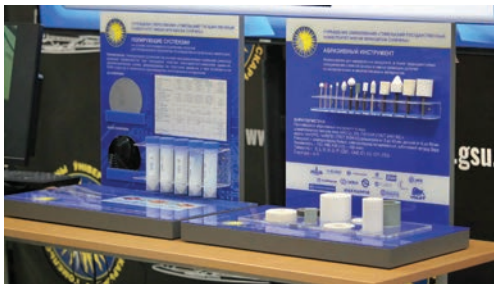
Выставка достижений вызывает гордость