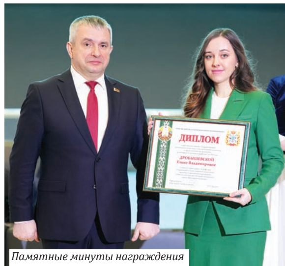
Памятные минуты награждения

Почетной грамотой областного Совета депутатов за высокие показатели в научно-исследовательской и педагогической