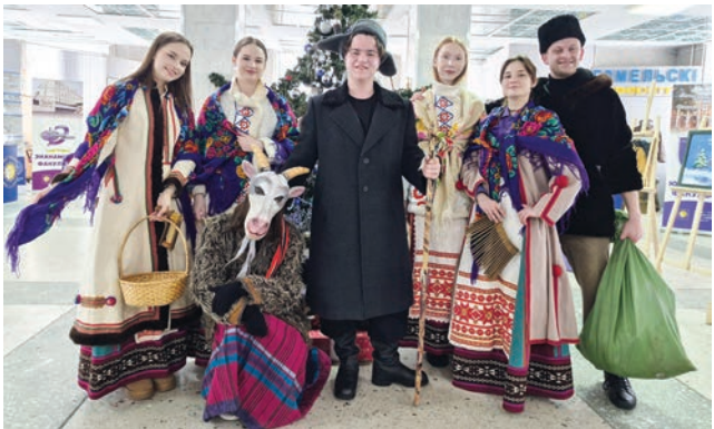
В преддверии старого Нового года отдел культуры и досуга молодежи ГГУ подарил коллективу по-настоящему колядное настроение. Даже январский мороз отступил перед задором ряженых