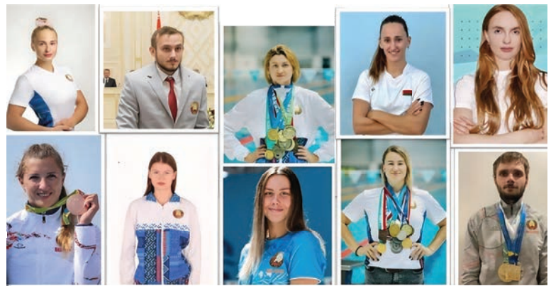
«Десятка» лучших спортсменов Гомельской области 2025 года