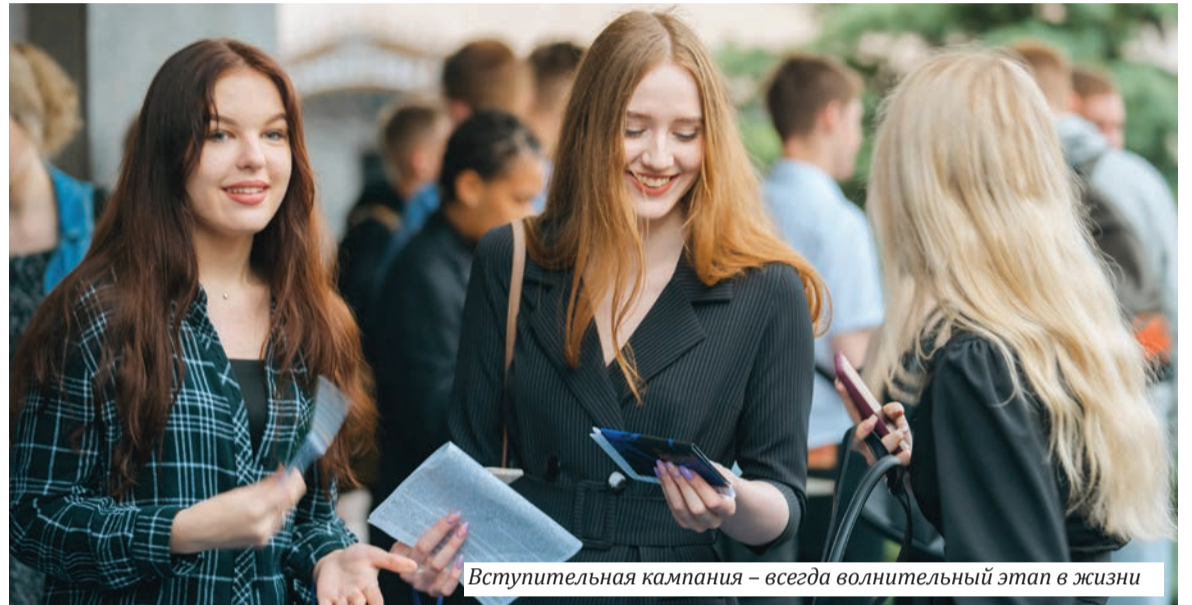
Вступительная кампания – всегда волнительный этап в жизни

Все выпускники получают 100%-е распределение, что под-