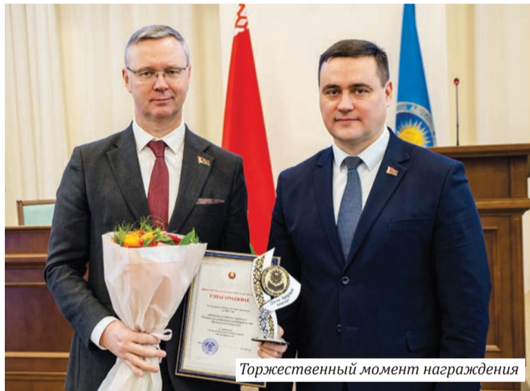
Торжественный момент награждения

В университете на 11 факультетах трудятся около 1070 работников. Профессорско-преподавательский состав включает более 478 человек. Образовательный процесс осуществляют